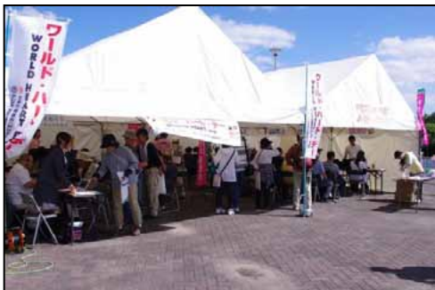
⑦ブース出展では、神戸常盤大学による「まちの保健室」、世界心臓連合ブースが大人気。「まちの保健室」では血圧測定、体脂肪などセルフチェックができ、また「あなたの心臓年齢を知ろう」のではコーナーも好評だった。