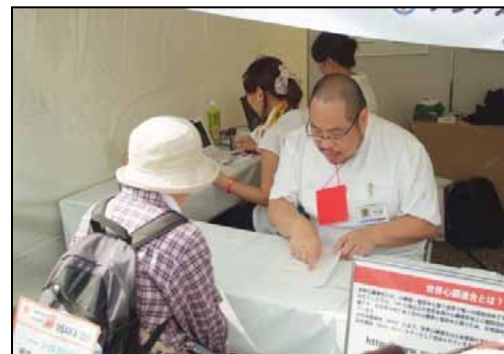
⑤ゴール会場:ゴール会場では、豪華景品が当たる抽選会も開催。また、ブースでは世界心臓連合のパネルを掲示するほか、「あなたの心臓年齢を知ろう」のコーナーを展開し、多くの方が参加した。