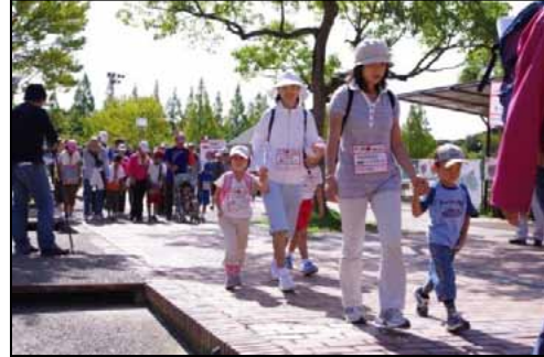
⑤保育の部では多数の子供連れの姿も見られた。