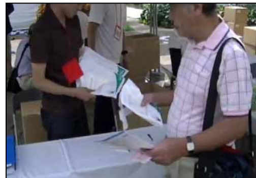
④サンプリング:ゴール後、公式パンフレット及び三つ折りリーフレット、などのサンプリングを行う。