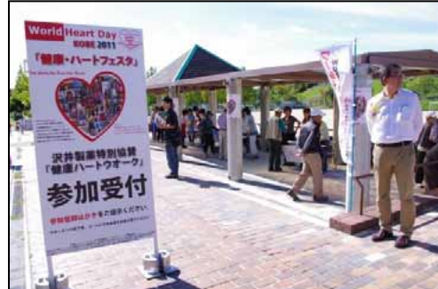
②午前9時より受付開始。ゼッケン・マップを配布。受付ボードにて、貴社の特別協賛をPR。