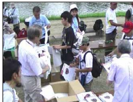
サンプリングを受け取る参加者