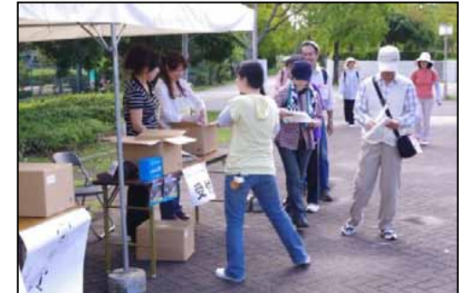
⑥ゴールでは、公式パンフレットなどののサンプリングを実施。特に特製缶バッジは人気が高く、追加希望の声も・・・。