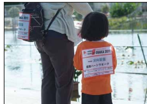
①受付：午前9時より8Km、4Kmに分けて受付を開始。早朝から集まった参加者にゼッケン・ウォーキングマップ・クイズラリー用紙を配布し芝生広場へ誘導。