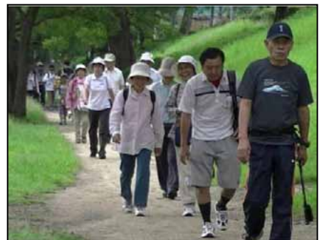
ウォーキングスタート