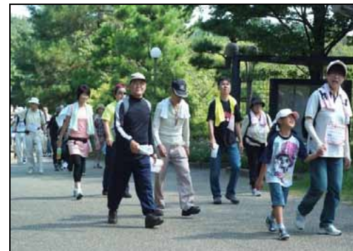
③ウォーキング：10時より4km8kmそれぞれスタート。好天のなか、緑豊かな鶴見緑地内で秋のウォーキングを楽しんだ。