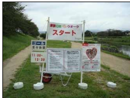
スタート地点では、ポスターも掲出