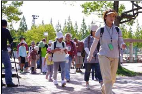
④一般コース、歩育コースに分かれスタート。年配の参加者も多く見られたが、年を感じさせない元気なウォーキングが見られた。