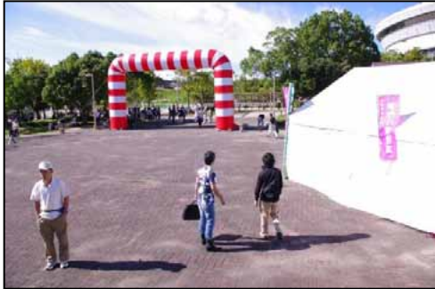
①当日は秋らしい天候となり、早い時間より参加者が会場に集合。参加意欲の高さが窺われた。