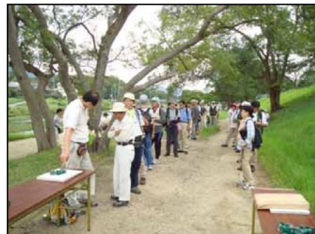
受付開始前には参加者で長い列が